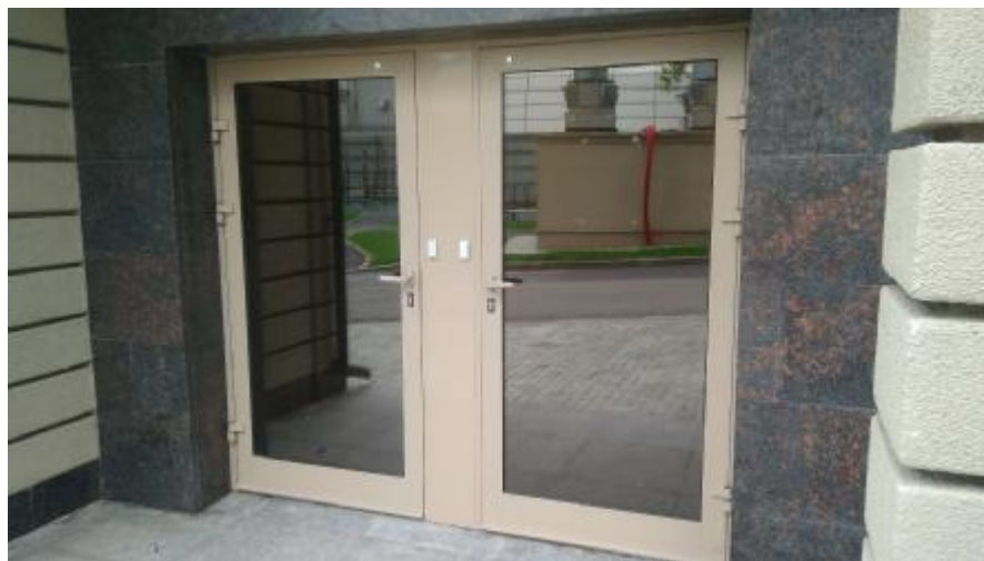
Считыватели карт для разблокировки двери

Выходы с пожарных лестниц и выход из подземного паркинга