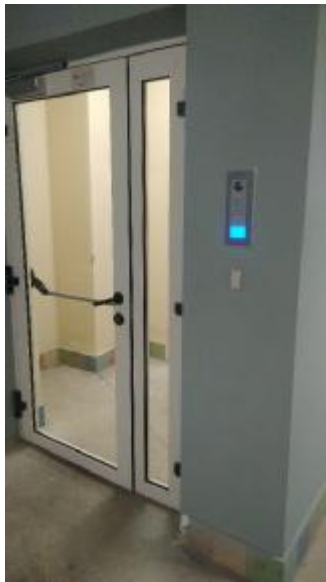
Вызывная панель для связи с диспетчером

Вход в лифтовой холл на «-1» и «-2» уровнях подземной парковки