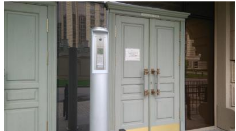
Вызывная панель на стойке