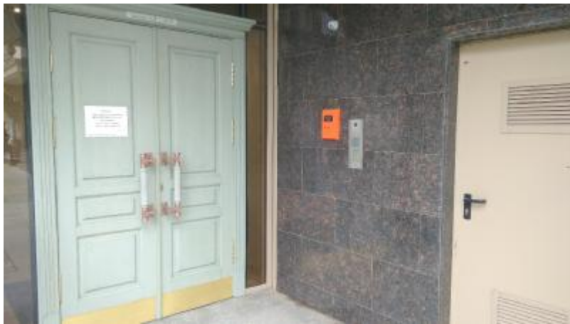
Вызывная панель на стене